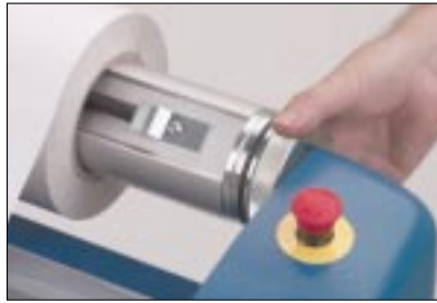
Auto-grip-Rollenhalter für einfache Beladung und Positionierung der Materialien, plus Integral Bremse für die einfache Einstellung der Folienspannung.