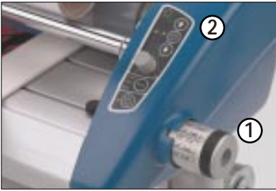
1. Ein Bedienungsschalter für die Einstellung der Materialstärke. 2. Bedienungsfreundliches Steuerpult für die Temperatur- und Geschwindigkeitseinstellungen.