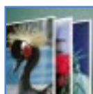
Feste Displays für den Innenbereich

Hervorragend für die Herstellung der folgenden populären Display-Anwendungen geeignet: