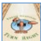
Begehbare Bilder für die Werbung auf Fußböden