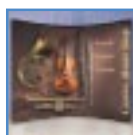
Pop-up- Display- Systeme

Die besten Ergebnisse erzielen Sie mit der SEAL 44 Ultra, wenn Sie die Laminier- und Klebefolien aus dem umfangreichen SEAL-Sortiment verwenden. Für eine schnelle und einfache Fertigung empfehlen sich die ProSEAL Pouch Boards und Schutzhüllen.