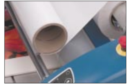
Innovative Arbeitsweise für die Entfernung des Abdeckpapiers.